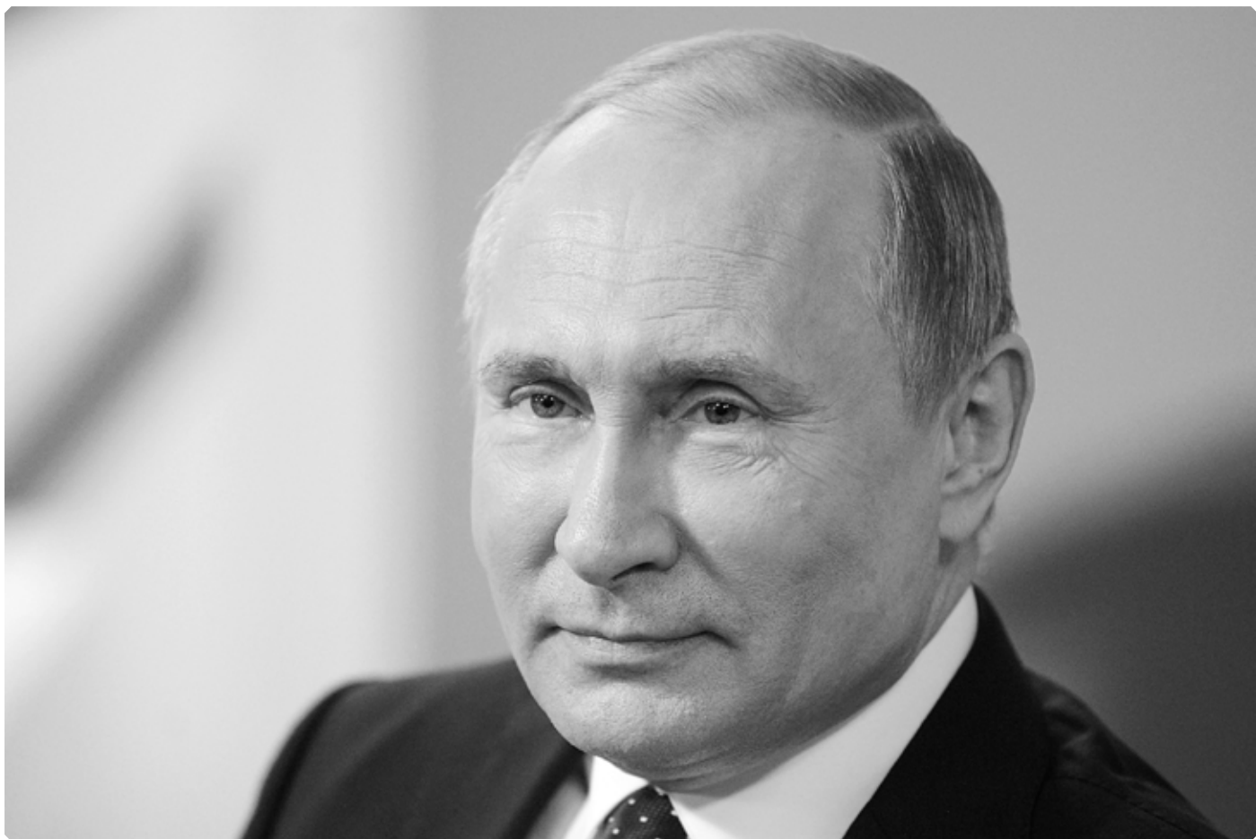
Президент Российской Федерации Владимир Владимирович Путин

прекрасно понимают, и именно этим обстоятельством объясняется их активность.