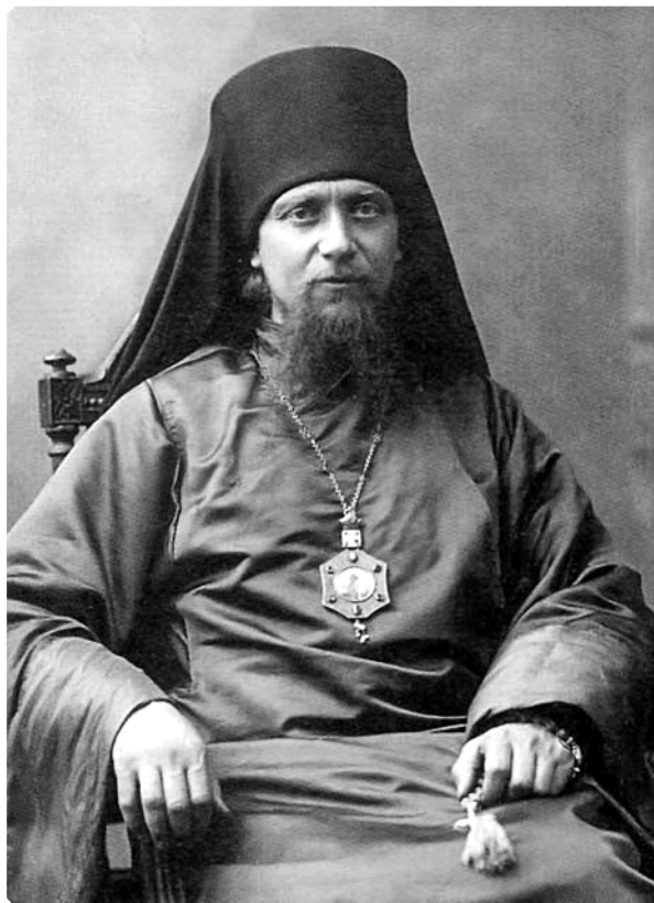
Преподобный Афанасий (Сахаров), епископ Ковровский. 1920-е гг.

А вот мысли нашего современника, святителя Афанасия (Сахарова), исповедника, епископа Ковровского: «Для духовенства вопрос о поминовении у нас стоит в тесной связи с вопросом о содержании. Но ведь надо же их разделить!.. Надо же знать и священнослужителям и мирянам, что долг первых – молиться о вторых и что этот долг они не леностно и неустанно должны исполнять без всякой мысли о вознаграждении. Миряне же должны знать, что они должники священнослужителей и свой долг должны уплачивать в первую очередь молитвою же о пастырях духовных. А так как постоянное, почти