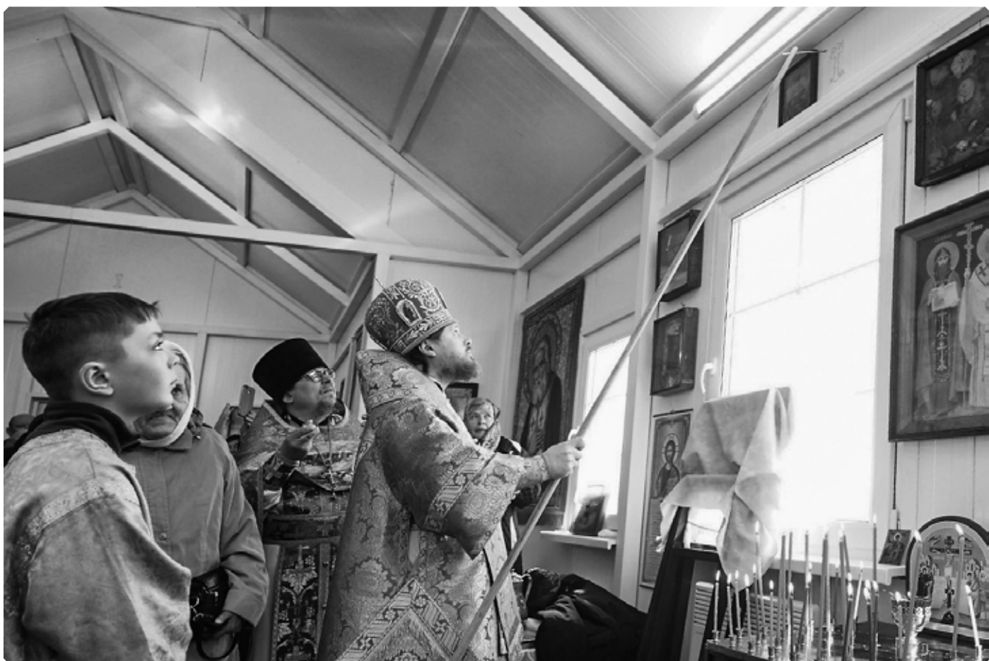
В ознаменование освящения храма благодатию Божиею помазание стен храма миром совершает управляющий Бийской епархией епископ Серафим. Храм Пророка Илии. Село Новообинка. 9 апреля 2022 г.