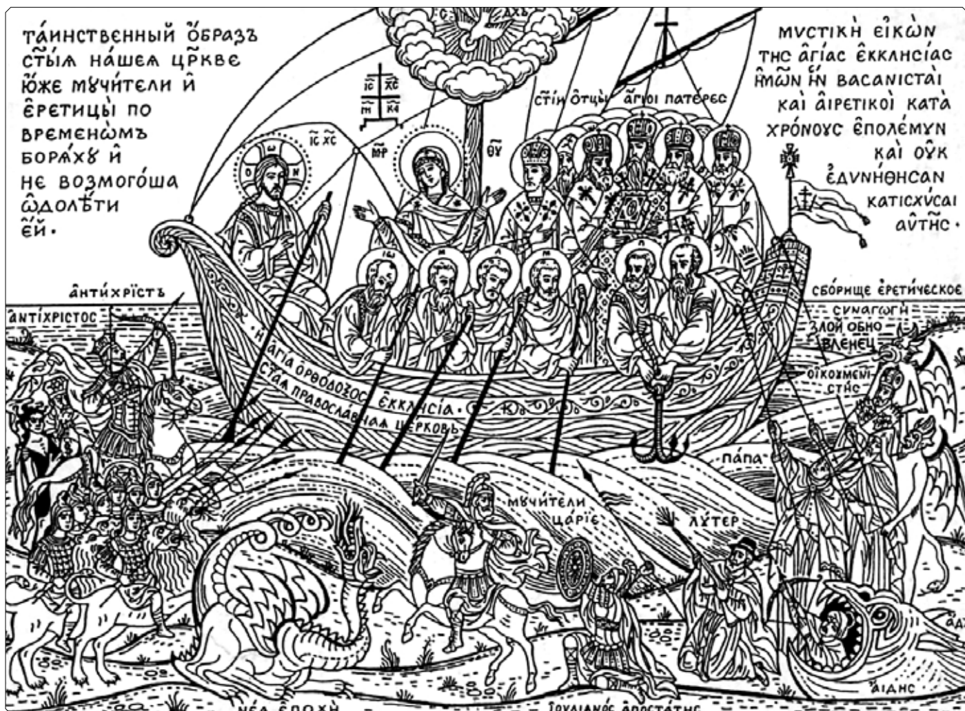
«Таинственный образ Святыя нашей Церкви».

Гравюра с фрески Зографского монастыря на Святой горе Афон. XIX в.