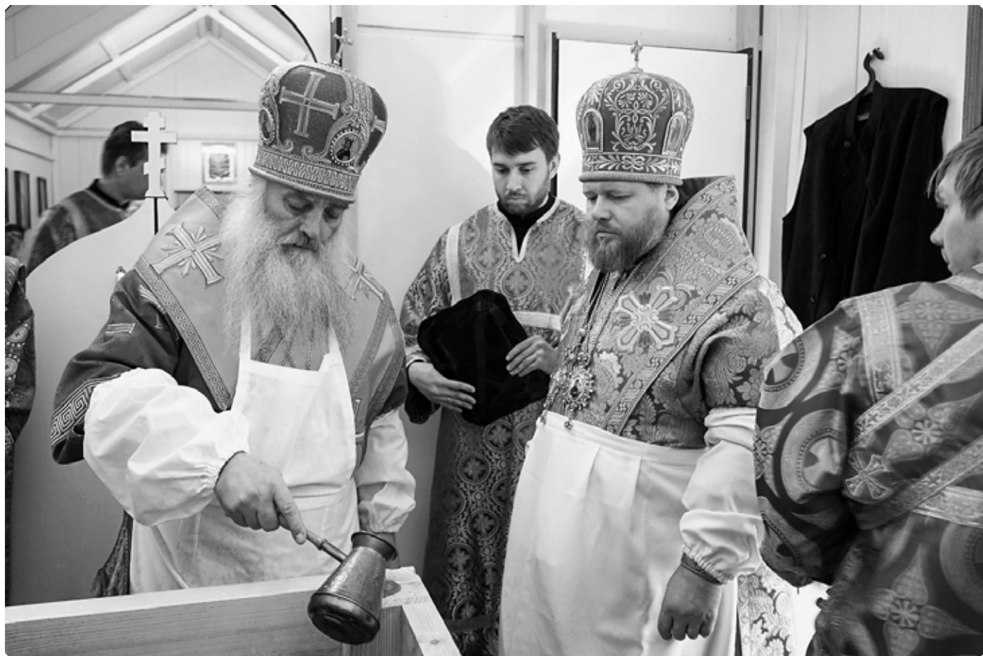
Архиереи Алтайской митрополии: митрополит Сергей (Иванников) и епископ Серафим (Савостьянов) за устройством престола в алтаре храма Пророка Илии. Село Новообинка. 9 апреля 2022 г.

обоего пола в особый, приписной к Ново-Обинскому, приход с самостоятельным хозяйством при местной Михаило-Архангельской церкви. Приходом заведует священник Д.П. Доброхотов и пользуется диаконскими доходами из общей кружки при самостоятельной Пророко-Илиинской церкви, при которой в состав причта он и считается».