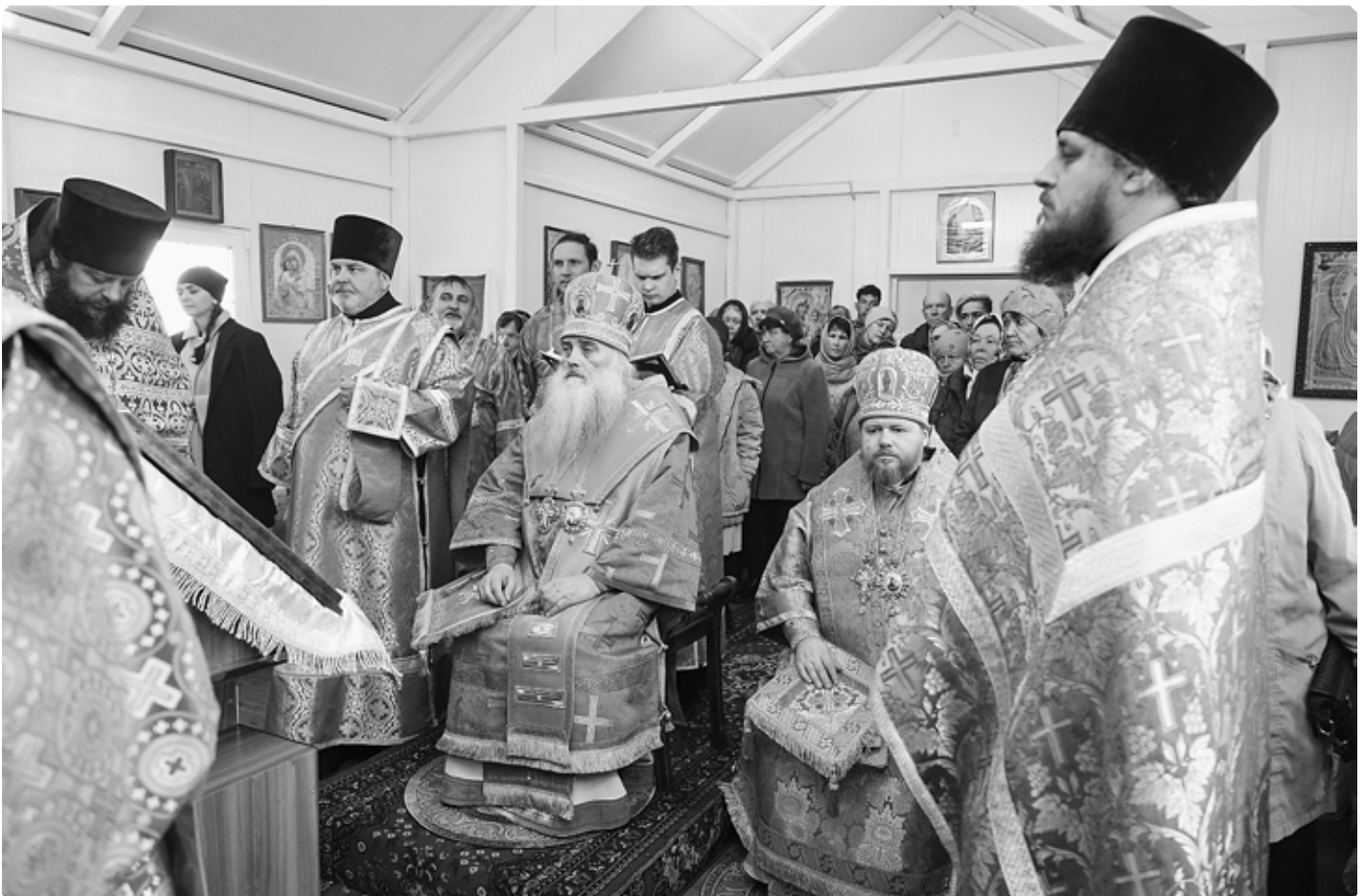
Незабываемые мгновения праздничного богослужения стали историей Новообинского прихода. Храм Пророка Илии. Село Новообинка. 9 апреля 2022 г.