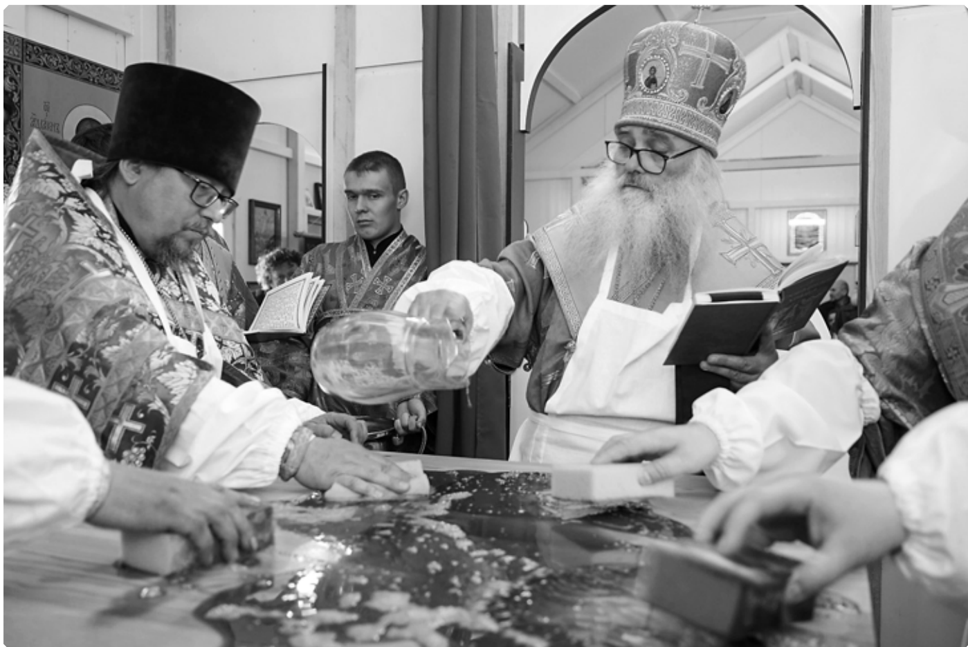
Омовение престола. Алтарь храма Пророка Илии. Село Новообинка. 9 апреля 2022 г.