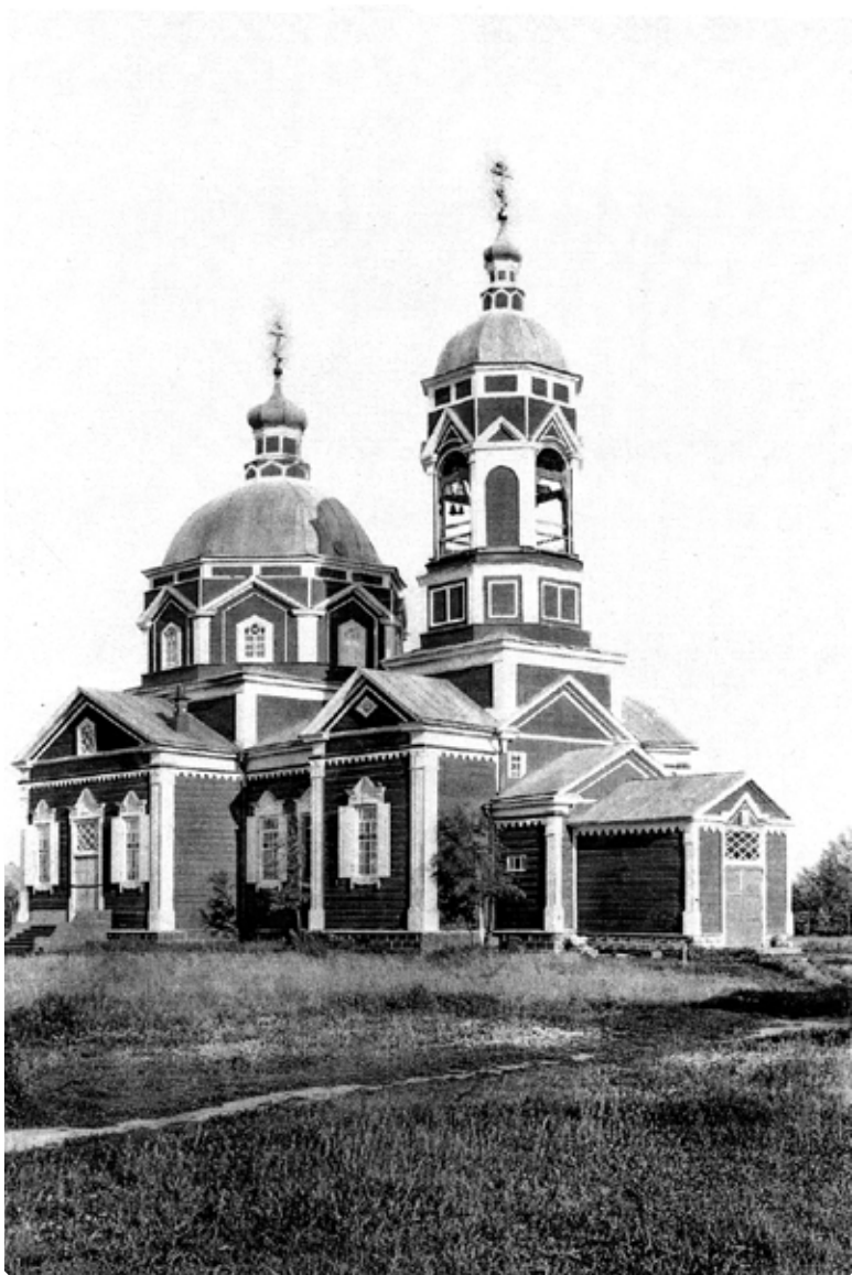
Храм Богоявления Господня, 1892 г. постройки. Село Соколовское Бийского уезда

«28 марта текущего года разрешено открыть школу грамоты в деревне Топольной».