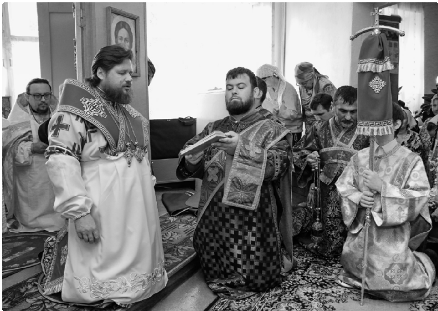
Преосвященный Серафим, епископ Бийский и Белокурихинский, освящает молитвенное помещение во имя святого Пророка Божия Илии. Село Новообинка. 22 июня 2019 г.

книг по Томской епархии» за 1898–1899 и 1902–1903 годы, приведены материалы из «Томских епархиальных ведомостей» за 1904 год и сведения из других источников.