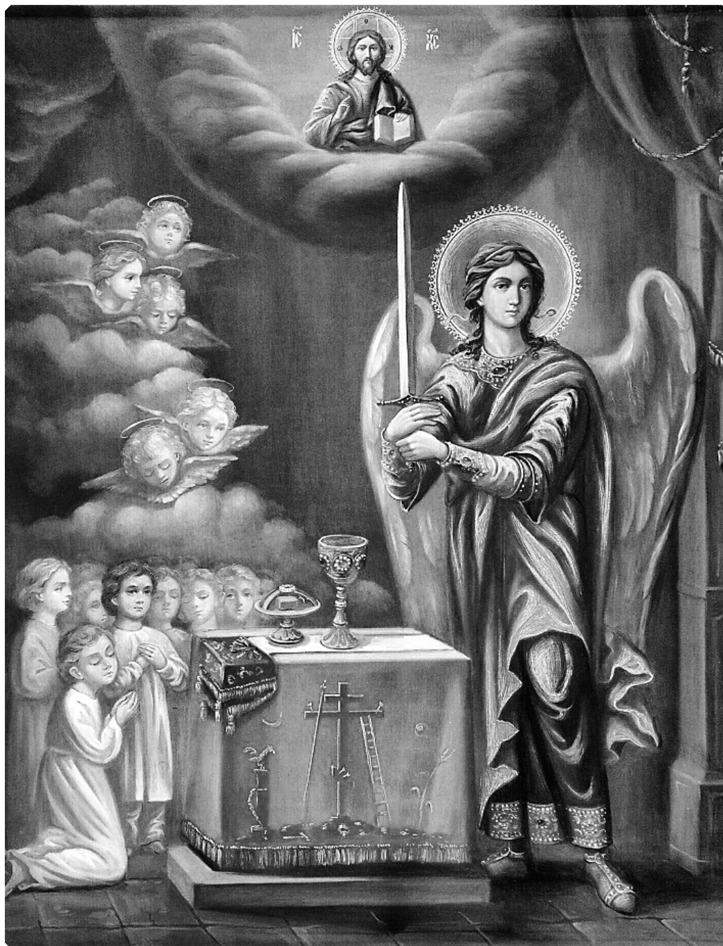
Ангел Хранитель жертвенника. Современная русская икона

Святых Тайн. Войдя в храм, я увидел Ангела, стоящего по правую сторону престола. Пораженный ужасом, я удалился в свою келию. И был голос мне: «С тех пор, как освящен этот престол, мне заповедано неотлучно находиться при нем»»).