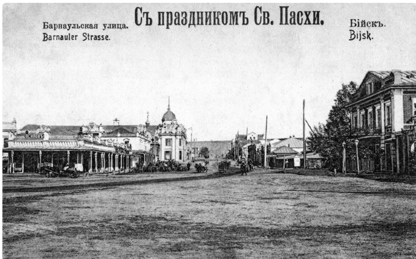
Барнаульская улица (ныне проспект имени С.М. Кирова). 1910-е гг. Почтовая карточка. БКМ

«Марк Георгиевич Пискарев (род. 1840 г.) – купец 2-й гильдии, торговал в Бийске в 80-х годах XIX в. В 1883 г. обороты его торговли составляли 25 тыс. руб. В 1894 г. имел в Бийске магазин с мануфактурным товаром при собственном доме и мануфактурную лавку на Базарной площади. Торговые обороты этих заведений составляли 24 тыс. руб. В 70-х гг. до принятия в Бийске