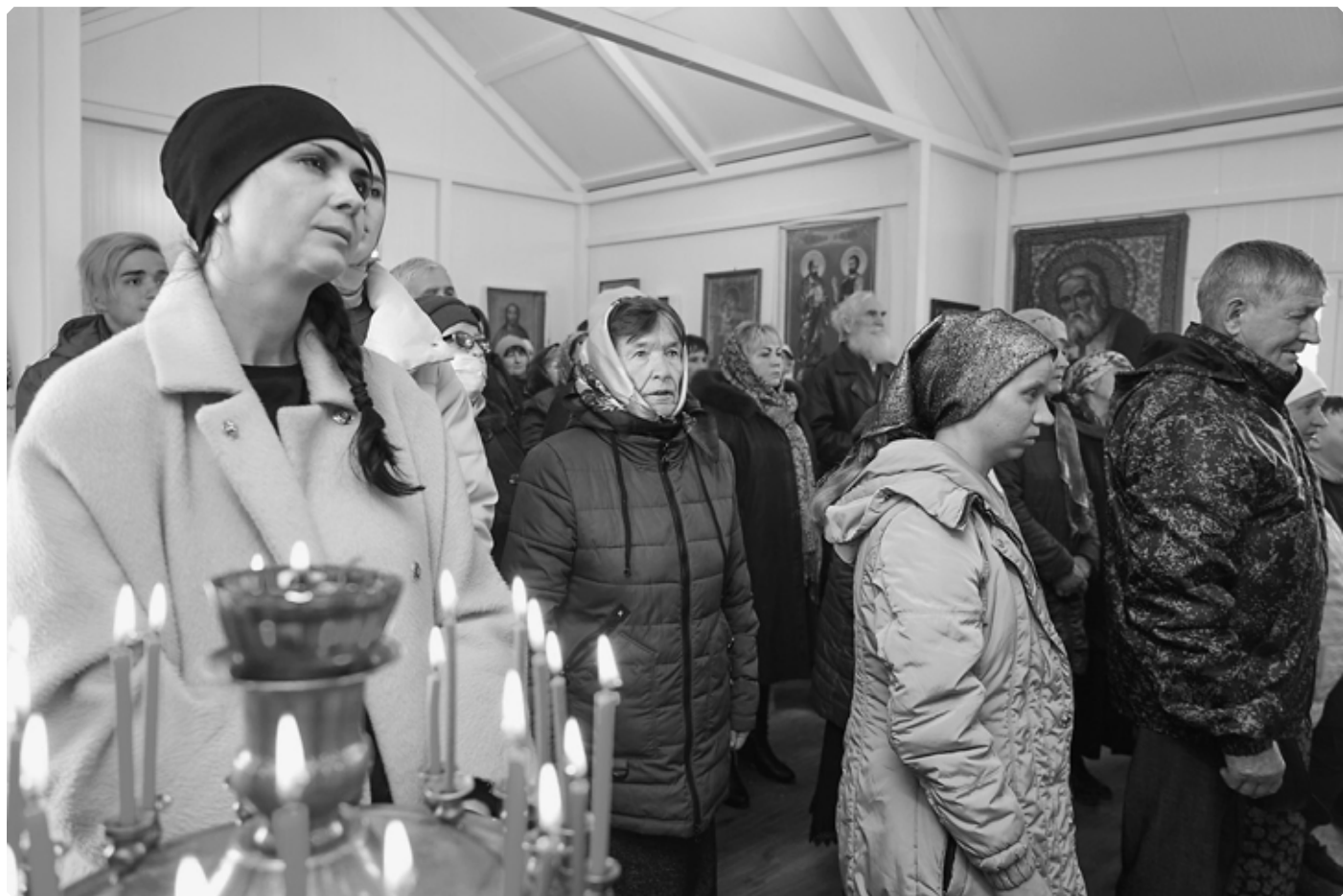
«...благодарственная воспоем Ти, раби Твои, Богородице...» Храм Пророка Илии. Село Новообинка. 9 апреля 2022 г.

ли это фантазией?! Может быть, я видел сон? Может быть, у меня галлюцинации?»